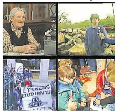
Table ronde sur les reportages à réaliser et à publier sur TV-Trégor. Les personnes intéressées par la vie locale

et la vidéo sont invitées à se joindre à l'équipe. Formation de base prévue pour les débutants. En ligne cette semaine sur tv-tregor.com retour sur les Vidéochroniques de janvier 1987.