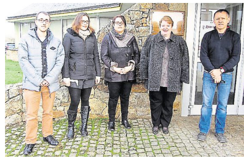
Quatre agents recenseurs se partageront le territoire de la commune.

En 2017, le recensement se déroule dans 7 000 communes de moins de 10 000 habitants, du jeudi 19 janvier au samedi 18 février.